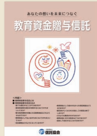
②教育資金贈与信託