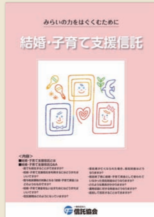
①結婚・子育て支援信託