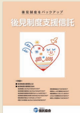
④後見制度支援信託